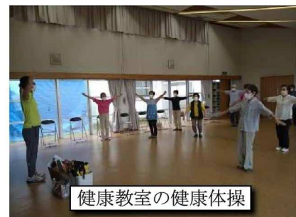
健康教室の健康体操

卓球教室 は、本年度から初心者向け（親子参加）の卓球教室も開催することにして、参加者を募集した結果、6件の申込みがありました。コロナ禍が落ち着いてきた7月下旬以降、主に土曜日を上級者、日曜日を初心者向けの卓球教室に分けて活動しました。