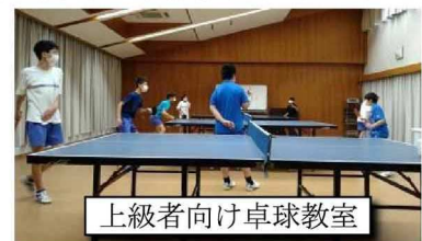
上級者向け卓球教室

●本地地域力向上委員会では、上記の他に ゴミのポイ捨て一掃大作戦 や 子どもサロン あいさつ運動 等も開催・活動しています。皆様も奮ってご参加ください。お願いします。