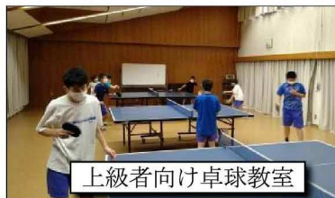
上級者向け卓球教室