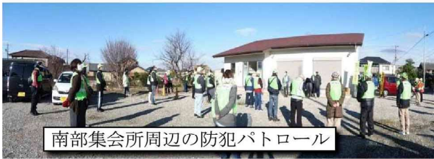
南部集会所周辺の防犯パトロール