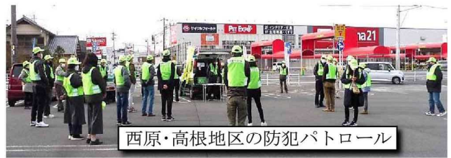
西原・高根地区の防犯パトロール