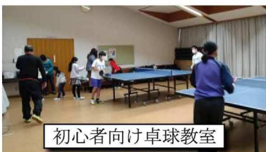
初心者向け卓球教室

卓球教室 は、本年度から初心者向け（親子参加）の卓球教室も開催することにして、参加者を募集した結果、6件の申込みがありました。コロナ禍が落ち着いてきた7月下旬以降、主に土曜日を上級者、日曜日を初心者向けの卓球教室に分けて活動しました。