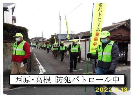
西原・高根 防犯パトロール中