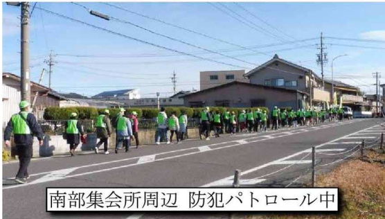
南部集会所周辺 防犯パトロール中