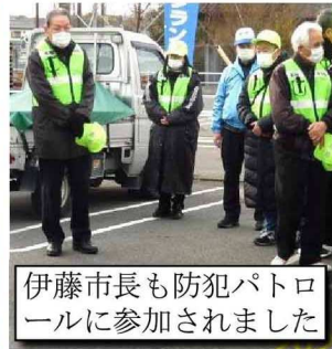
伊藤市長も防犯パトロールに参加されました