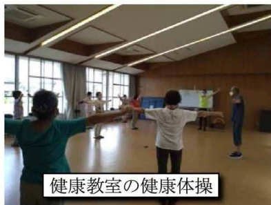
健康教室の健康体操