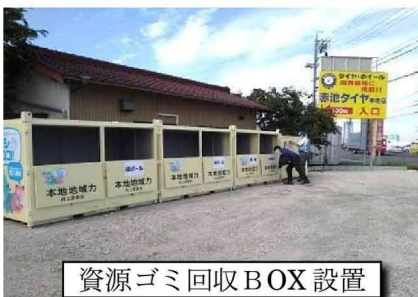
資源ゴミ回収BOX設置

本事業は瀬戸市の地域力市民活動組織等では初めての試みで、瀬戸市役所や他の地域活動組織からも注目されています。具体的には瀬戸市では「瀬戸まちの活動センター」の広報誌で紹介され、提携回収業者の「株式会社石川マテリアル様」ホームページでも、本地地域力向上委員会とのコラボ事業として紹介されていますので、ぜひ一度ご覧になってください。今後とも資源ゴミの回収にご協力の程、よろしくお願いいたします。