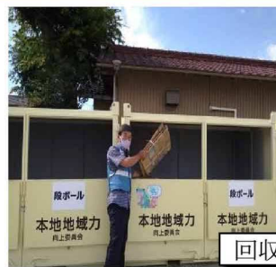
回収BOX設置の開所式